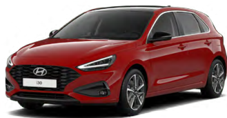
Engine Red Pastelová Cena: 0 Kč