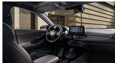
Černý interiér N line – látkové čalounění s červeným prošíváním a logem N – černé čalounění stropu a obložení bočních sloupků – červeně prošívavý sportovní volant, hlavice řadící páky a loketní opěrka