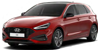
Ultimate Red Metallic Metalická Cena: 16 900 Kč