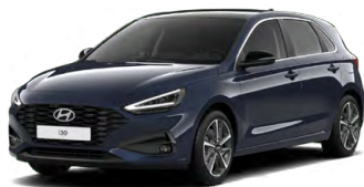
Sailing Blue Pearl Perleťová Cena: 16 900 Kč