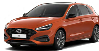
Jupiter Orange Metallic Metalická Cena: 16 900 Kč