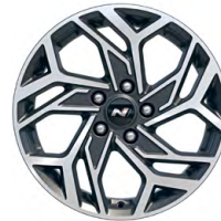
17" kola z lehké slitiny – N Line