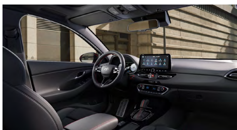
Černý interiér N line Premium – prémiové čalounění v kombinaci kůže/semiš – černé čalounění stropu a obložení bočních sloupků – červeně prošívavý sportovní volant, hlavice řadící páky a loketní opěrka