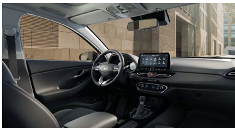
Černý interiér Oceanidis Black Premium – kožené čalounění sedadel – černé čalounění stropu a obložení bočních sloupků – světlé čalounění stropu a obložení bočních sloupků – černé provedení přístrojové desky a výplní dveří