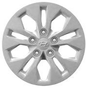
15" ocelová kola s celoplošnými kryty