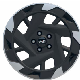
19" kola z lehké slitiny N Line